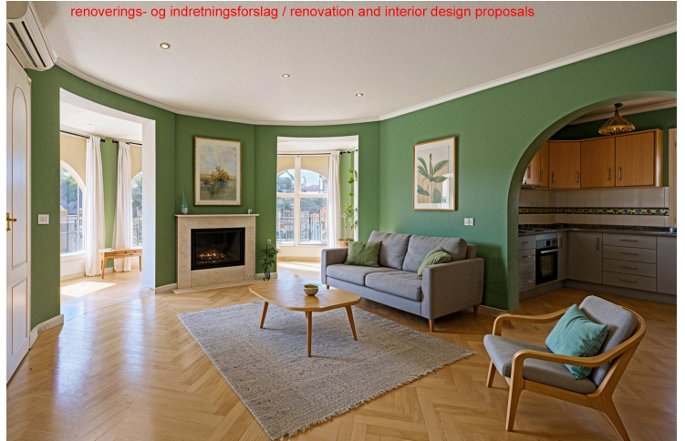
renoverings- og indretningsforslag / renovation and interior design proposals