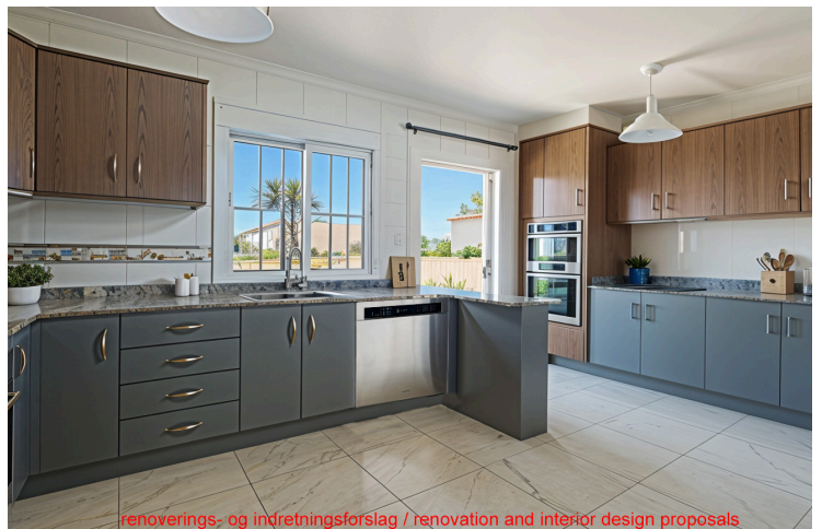
renoverings- og indretningsforslag / renovation and interior design proposals