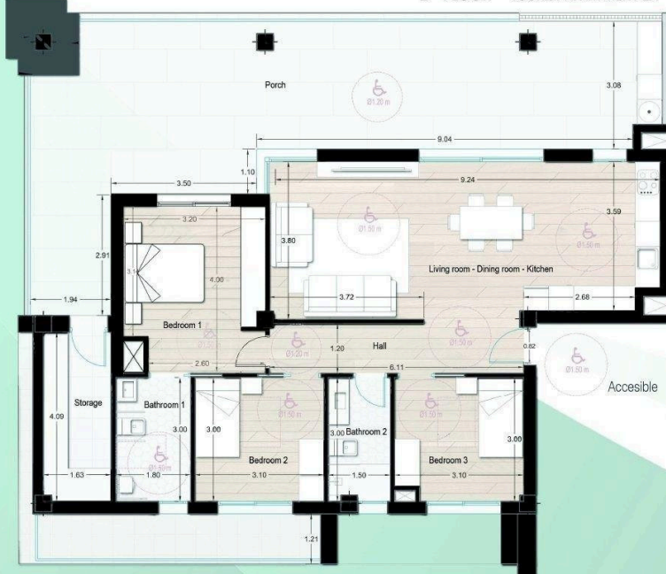
BLOCK A 2 nd FLOOR TOURIST APARTMENT 2A