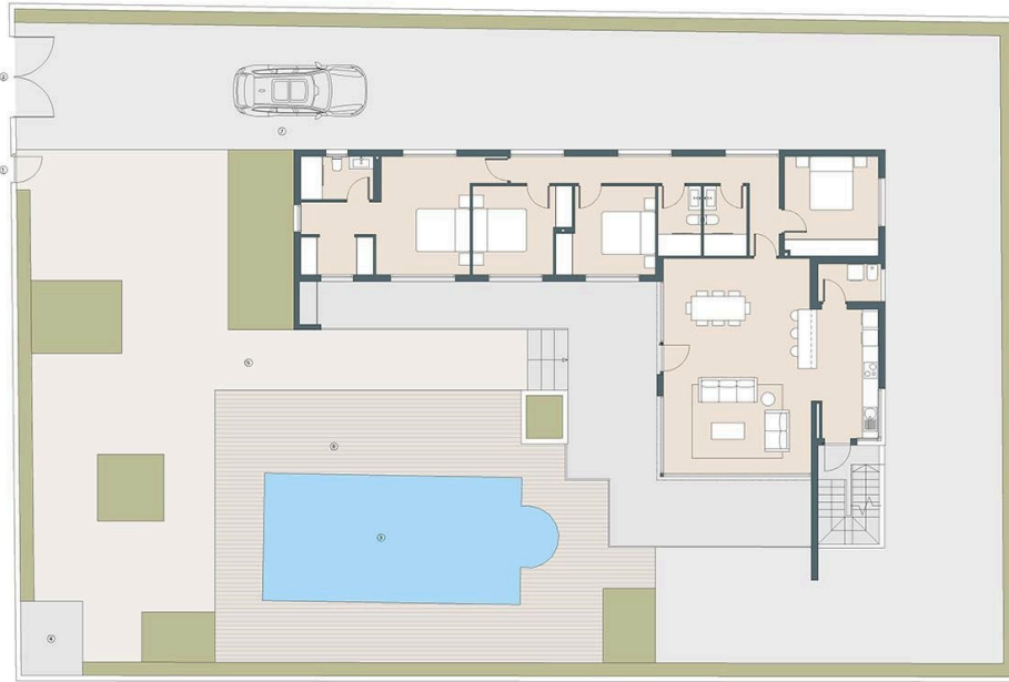
PLANTA GENERAL/GENERAL PLAN