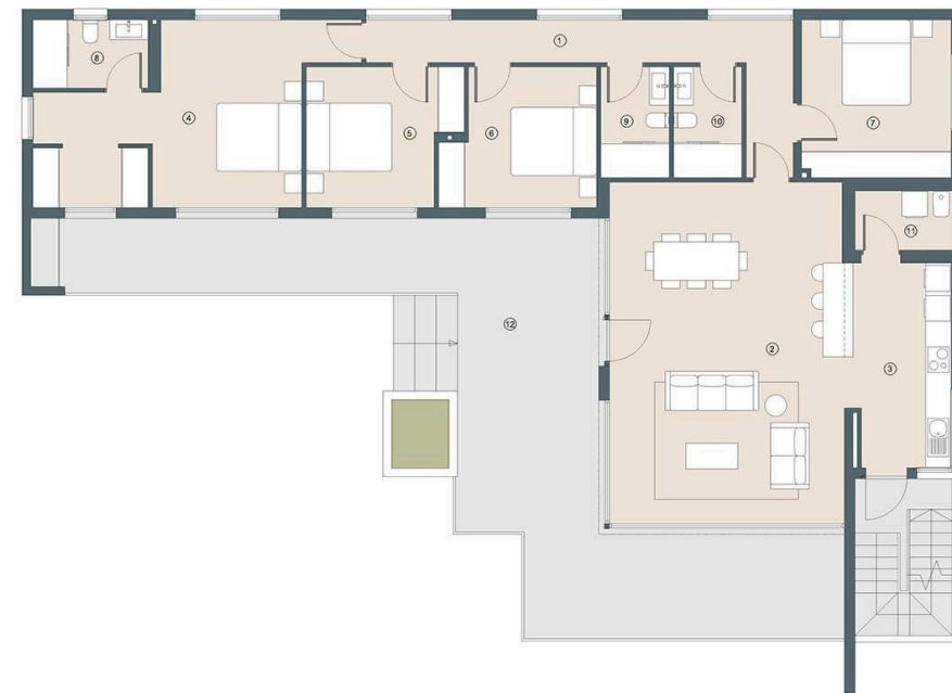
PLANTA BAJA/GROUND FLOOR